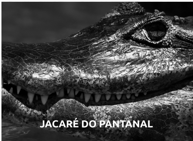
JACARÉ DO PANTANAL