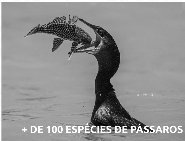
+ DE 100 ESPÉCIES DE PÁSSAROS